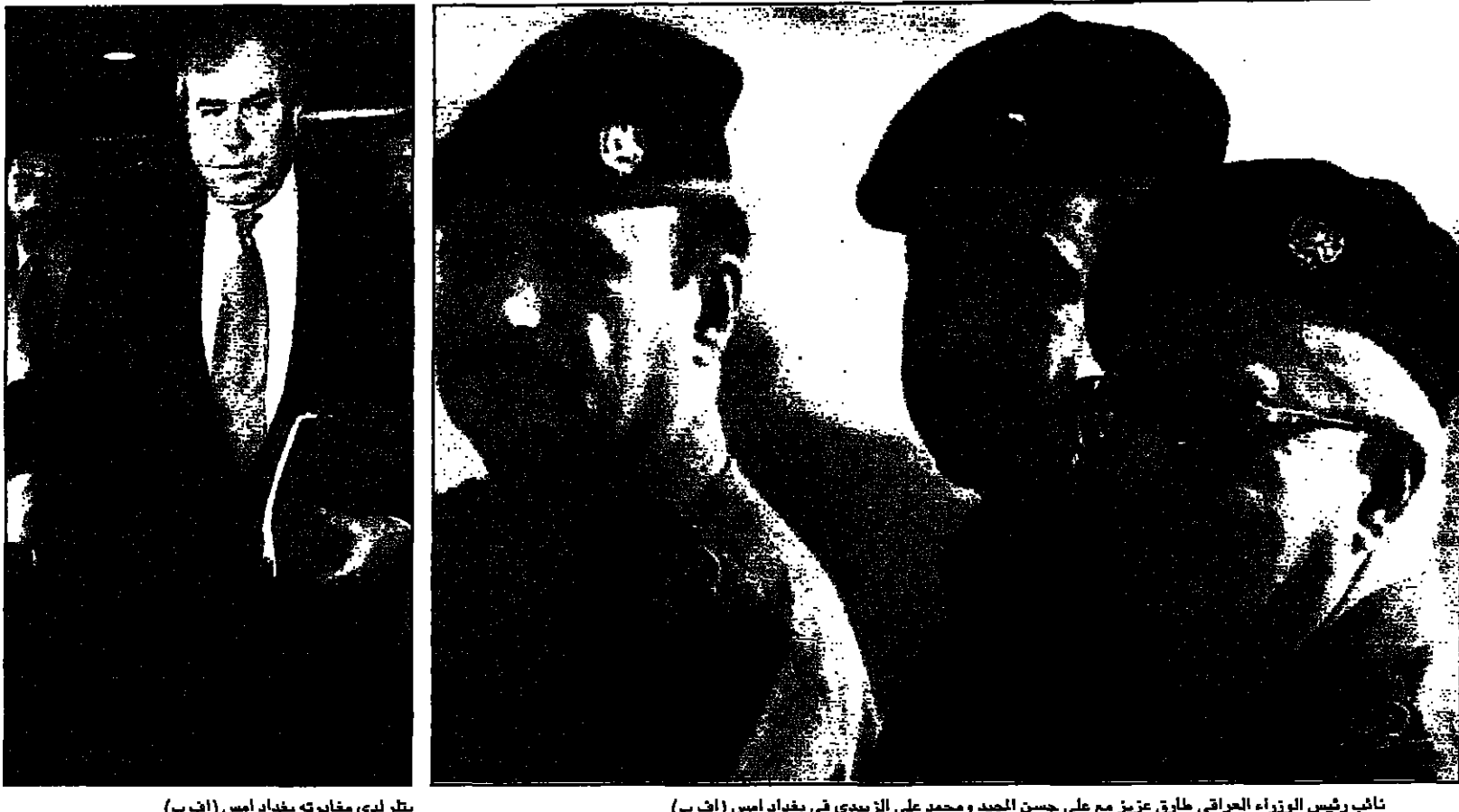
نائب رئيس الوزراء العراقي طارق عزيز مع علي حسن المجيد ومحمد علي الزبيدي في بغداد امس (أ ف ب)